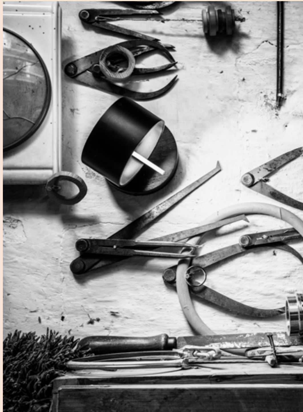
AAMU-UNIKATE mit stilvollem Design und wachsender Patina. Sie könnten nicht zeitloser und moderner sein. Schon morgen prägen sie eine neue Generation, für die wir heute neue, nachhaltige Wege gehen.