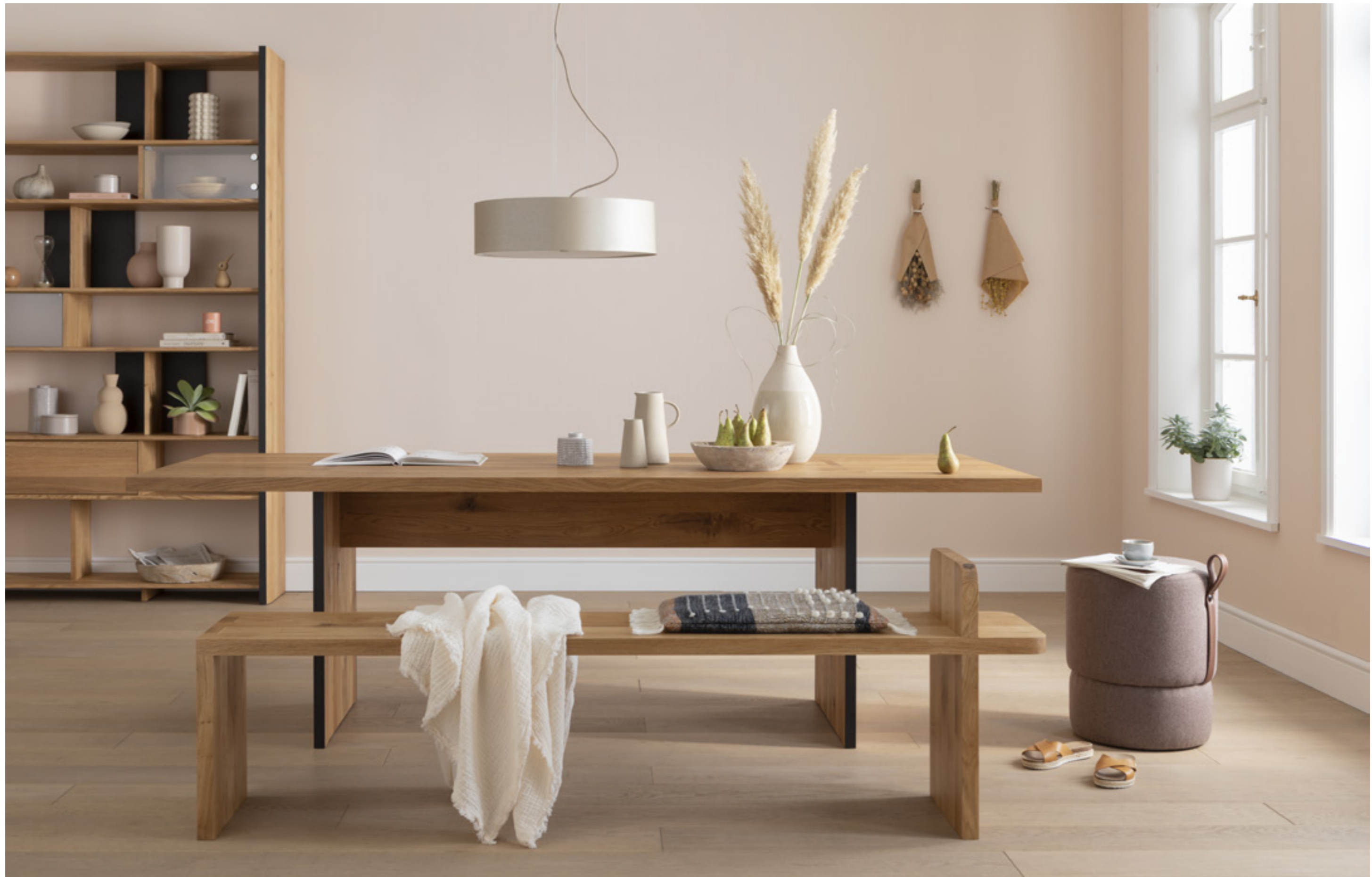
Gemeinsame Zeit. Nachhaltige Erinnerungen von heute für morgen. Wangentisch und Bank EDIA sind gezeichnet von der Natur und wie für unser Leben gemacht. Designer Oliver Conrad verbindet tradierte Handwerkskunst mit skandinavischem Lebensgefühl. Ganz natürlich ist Hocker BLOMMA ein Teil dieser aamu-Familie.