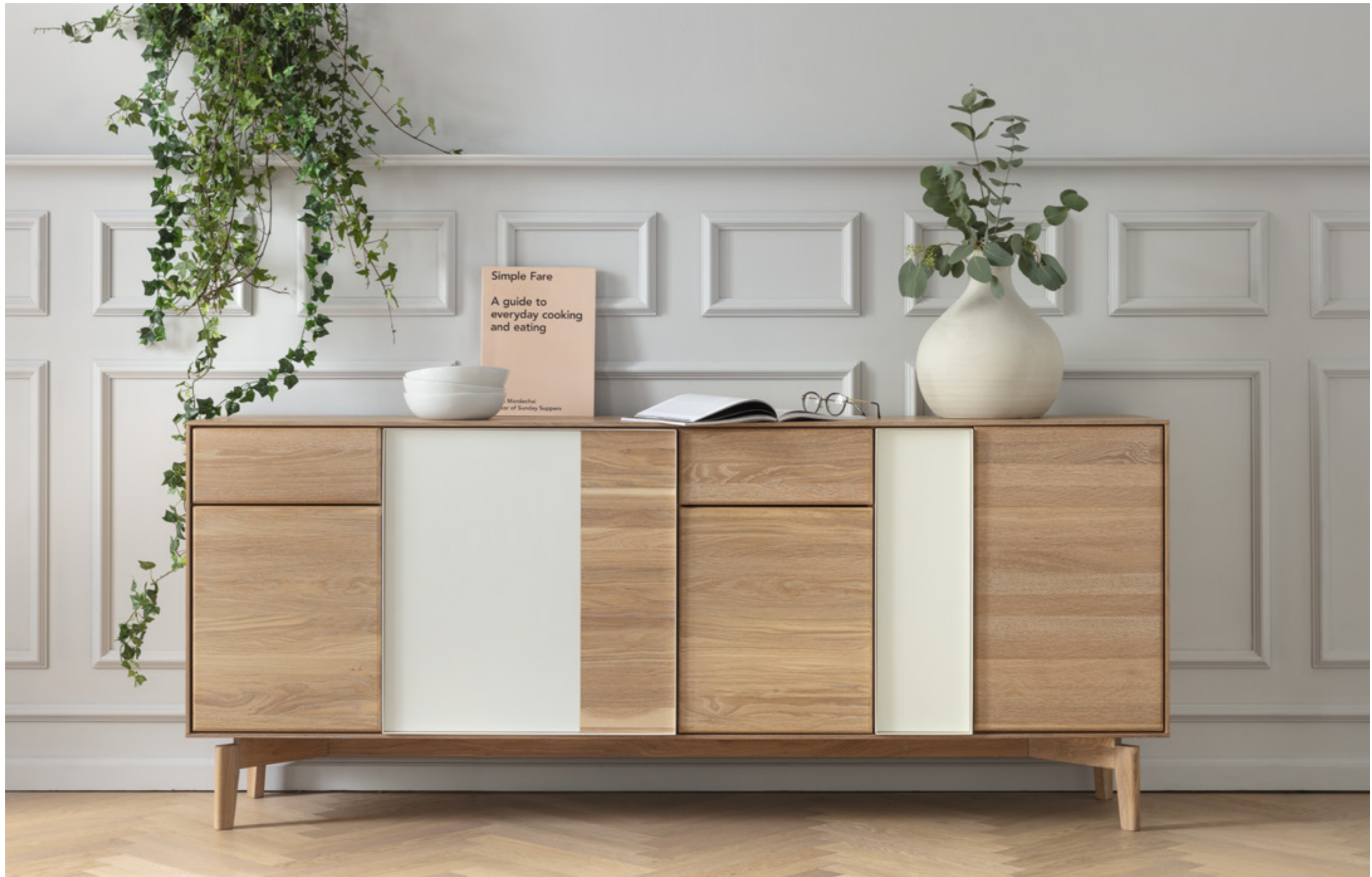
Anrichte LOVA ist ein aamu-Meisterwerk der handwerklichen Verarbeitung. Erfahrene Hände können Feinheiten wie abgerundete Kanten entstehen lassen. Der zeitlos moderne Charakter der Anrichte gelingt durch eingesetzte Metallrahmen, die die Einteilung der Fronten festlegen und als schlichter Griff dienen. In die Öffnung der Metallrahmen können Materialien wie Farbglass, chromfreies Leder oder natürlicher Stoff eingesetzt werden. Abgesetzt in der Höhe schwebt der Korpus luftig leicht auf seinem massiven Untergestell.