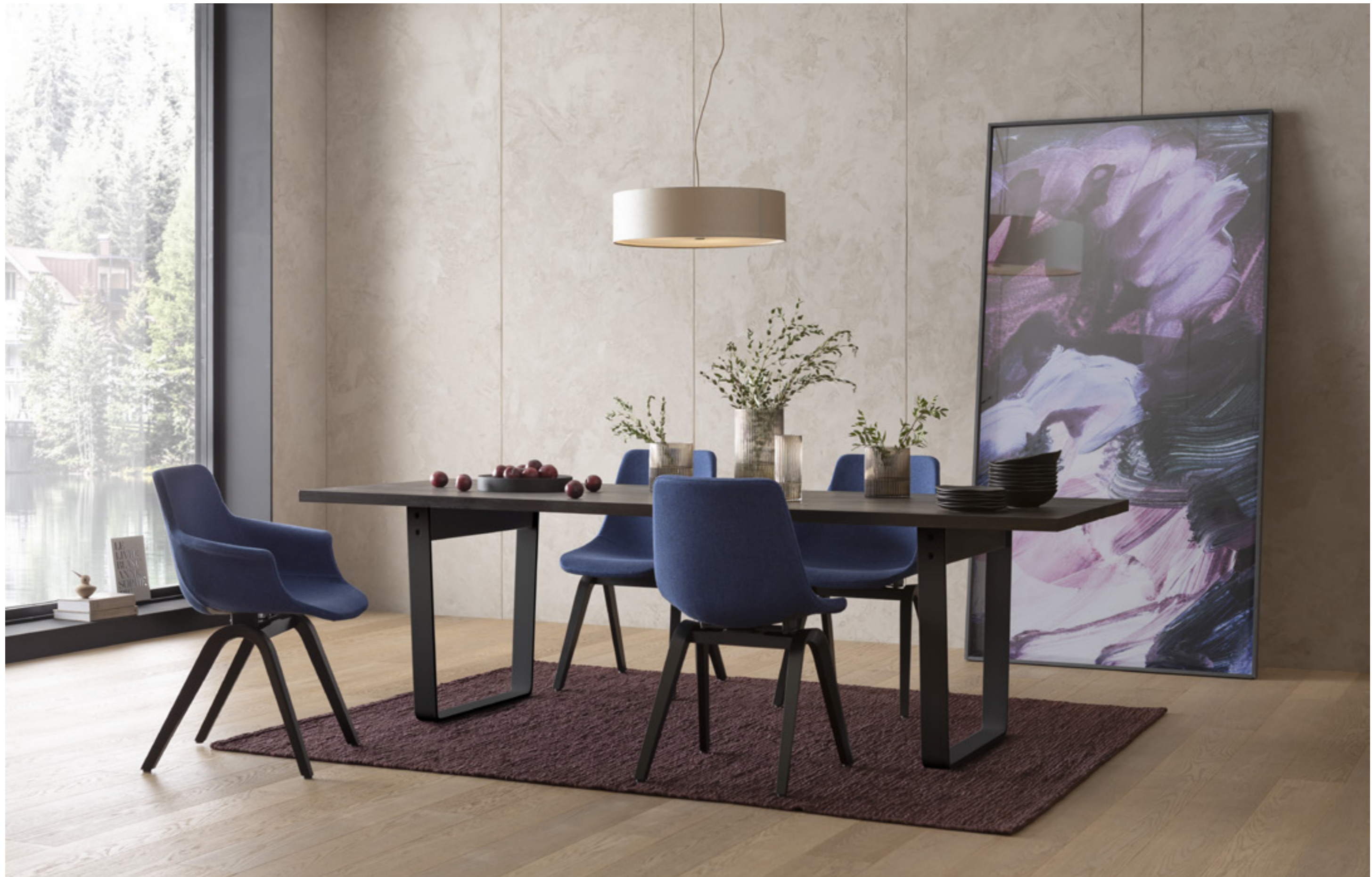
Tisch EMBLA aus jahrtausendealter Mooreiche zeigt, welch überwältigende Schönheit in der Natur steckt. Die aus dem vollen Stamm geschnittenen Riegel sind ausdrucksstarke Zeitzeugen, die jetzt auf einer von Oliver Conrad zeitlos designten Kufe ruhen. Stuhl ALVA bewegt beim Sitzen. Mit oder ohne Armschale, in 3 Höhen und 150 Farbvarianten der natürlichen Stoffbezüge wirkt ALVA aktiv und dynamisch auf den Körper ein. Entspanntes Wohnen erobert Raum.