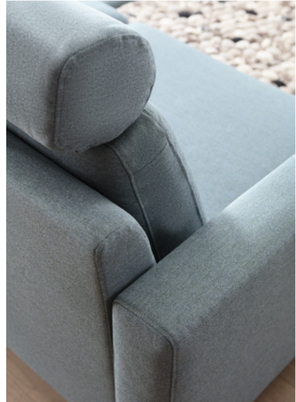
Regal EDIA (l.) verbindet wilde Holzarten mit grober Maserung und kühles Metall. Die graphitschwarzen Rückwandelemente ergänzen sich mit der gleichfarbigen Schattennut an den Wangen. Offen und geschlossen erzeugt die Asymmetrie der Fächer eine natürliche Optik. Sofa RONA (o.) ist ein handgefertigtes Modulsystem vom Einzelsofa bis zur Wohnlandschaft. Von Kopf bis Fuß für Individualisten planbar, beeindruckt es durch ergonomische Verstellmöglichkeiten und seine Naturpolsterung aus Kokos, Naturlatex und Schafschurwolle auf.